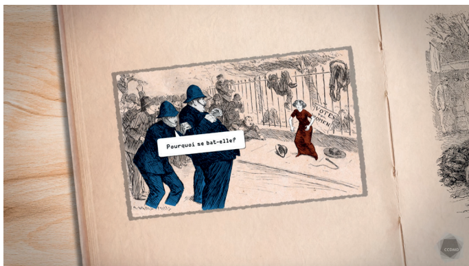
Extrait de la capsule vidéo Suffrage

Aujourd'hui, on utilise l'expression suffrage universel pour désigner un droit de vote accordé à tous les citoyens et citoyennes, sans restriction. Remarquons que le sens de « universel » a évolué avec les mentalités! Au 19 e siècle, il n'incluait pas les femmes et ne tenait pas compte des Noirs. Toutes sortes de critères peuvent restreindre le droit de vote, selon les époques et les régimes politiques : niveau de richesse, origine des parents, religion, sexe, âge, groupe social, etc.