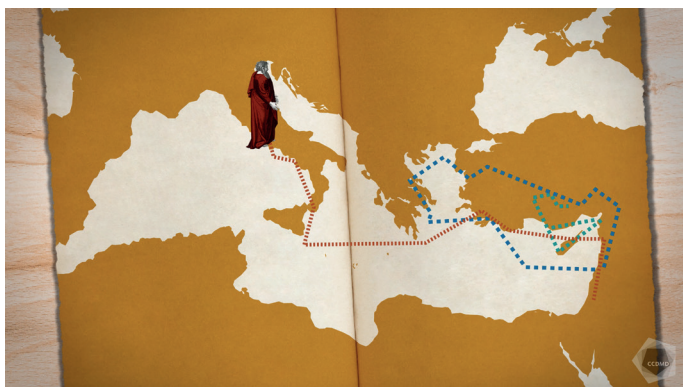
Extrait de la capsule vidéo Église

La diffusion du christianisme après la mort de Jésus s'est réalisée entre autres grâce aux efforts de Paul de Tarse (saint Paul), un citoyen romain juif parlant très bien le grec qui voyagea beaucoup pour fonder des communautés de fidèles, spécialement en Grèce. Ces assemblées des premiers chrétiens prirent très simplement le nom d' ekklesia . La multiplication des adeptes à l'intérieur de l'Empire romain fit passer le mot au latin : ecclesia , qui donnera le nom et l'adjectif ecclésiastique (latin ecclesiasticus ). Au Moyen Âge, ecclesia désigne aussi le temple où se réunissent les chrétiens. Notons que pour nommer le bâtiment, église s'écrit avec un « é » minuscule, alors que pour l'institution, la communauté, il nécessite une majuscule : Église .