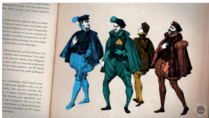
Extrait de la capsule vidéo Bourgeoisie

Grâce à l'essor du commerce, une classe sociale nouvelle apparaît donc, ni noble ni paysanne, et possédant des biens. Au 17 e siècle, le mot n'a plus aucun lien avec l'idée de « village » ou de « ville ». Avec l'industrialisation, le terme bourgeoisie s'opposera à classe ouvrière , l'une possédant les capitaux et tous les moyens de production, l'autre étant exploitée par la première et réduite à la pauvreté. Le 19 e siècle verra s'affirmer la domination tant politique qu'économique de cette classe sociale qui imposera aussi son mode de vie conformiste et son idéologie.