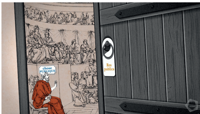
Extrait de la capsule vidéo République

Aujourd'hui, république réfère généralement à un régime politique où le pouvoir suprême vient du peuple . Est-ce une démocratie alors? Chez les Romains, certaines institutions donnaient la voix au peuple, mais l'essentiel du pouvoir restait entre les mains de quelques familles privilégiées. Il en va de même des Républiques italiennes du Moyen Âge. Au 20 e siècle, plusieurs régimes républicains sont des démocraties, le droit de vote étant accordé à l'ensemble des citoyens. Par contre, certains pays à régime communiste se sont donné le nom de « république » alors qu'y règne la dictature.