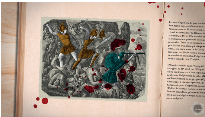
Extrait de la capsule vidéo Hégémonie

L'Empire romain dans l'Antiquité, l'Empire espagnol au 16 e siècle ou l'Empire britannique au 19 e siècle ont tous exercé leur suprématie. Signalons également l'hégémonie de villes (Byzance, Florence ou Tenochtitlan) ou de peuples (Égyptiens ou Allemands) à diverses époques. Au figuré, hégémonie peut s'appliquer à plusieurs domaines : l'Église, la science, les lois ou encore une langue. Peut-on considérer qu'aujourd'hui Internet occupe une position hégémonique dans nos manières de communiquer?