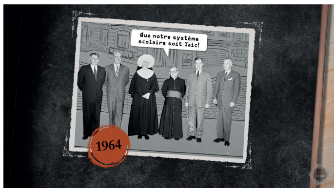
Extrait de la capsule vidéo Séculariser

Ajoutons par ailleurs que le mot latin sæculum , qui veut dire « siècle », a donné l’adjectif séculaire , qui signifie « tous les cent ans » ou « qui existe depuis des siècles ». Dans le vocabulaire religieux, séculaire a le sens de « appartenant au siècle », donc « pas du domaine religieux » (ou « profane »). Ainsi, le verbe séculariser (ou « laïciser ») se rattache à cette idée de « profane », bref, de ce qui appartient à la vie publique.