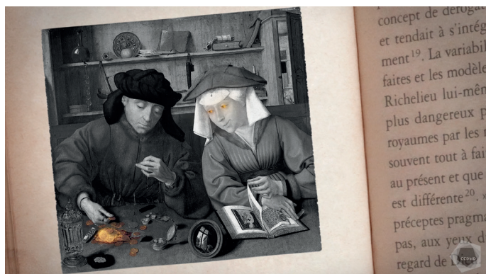
Extrait de la capsule vidéo Capitalisme

Avec la révolution industrielle, on inclura dans l'idée de capital tous les équipements (usines, machines, etc.) permettant de produire de la richesse. Les penseurs socialistes critiqueront ce système fondé sur la propriété privée, car la main-d'œuvre qui fabrique les biens ne connaît que l'exploitation, pendant que les capitalistes récoltent les profits. Le communisme proposera la mise en commun du capital et le partage des profits entre tous, pour une richesse collective plutôt qu'individuelle.