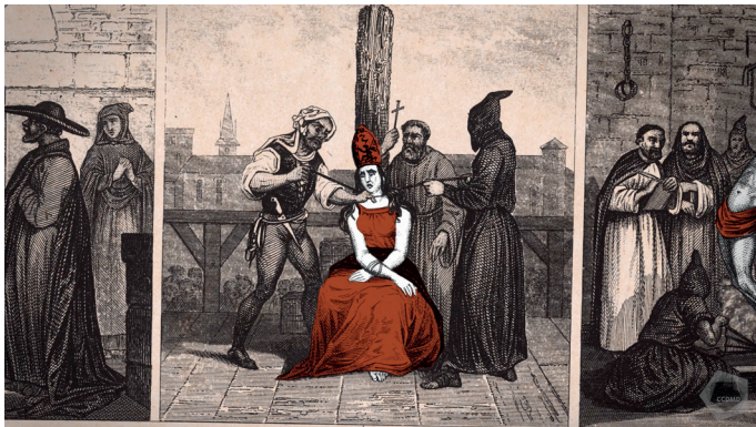
Extrait de la capsule vidéo Hérésie

Au nom du combat contre les hérésies, des guerres auront lieu. Aussi, plusieurs personnes, dont des dizaines de milliers de femmes, seront condamnées pour sorcellerie (aux 16 e et 17 e siècles surtout). D’autres subiront le jugement du puissant tribunal de l’Inquisition. Jan Hus est un exemple parmi tant d’autres : ce prêtre théologien, qui critiqua notamment la richesse de l’Église, fut jugé hérétique et brûlé vif en 1415.